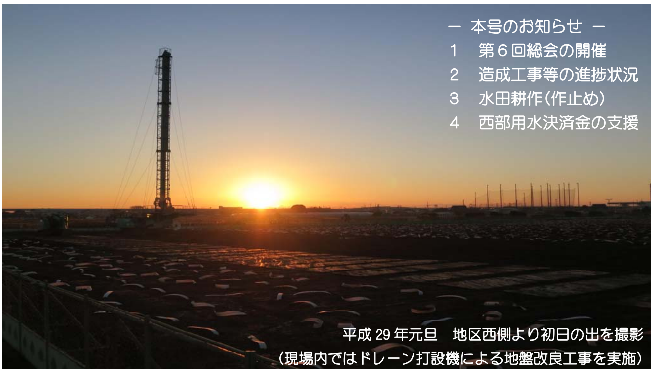
平成29年元旦 地区西側より初日の出を撮影 (現場内ではドレーン打設機による地盤改良工事を実施)