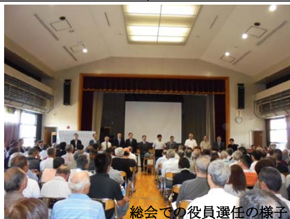
総会での役員選任の様子