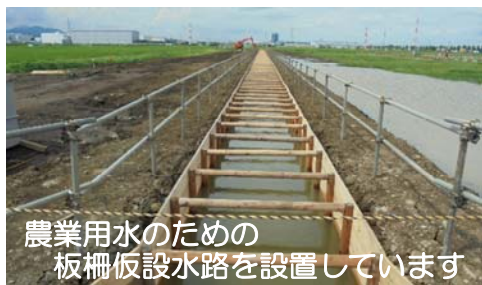
農業用水のための板柵仮設水路を設置しています