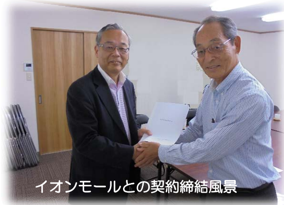
イオンモールとの契約締結風景

また、大和ハウス工業株式会社および平塚市とは、現在、保留地譲渡契約の時期等について協議を進めております。