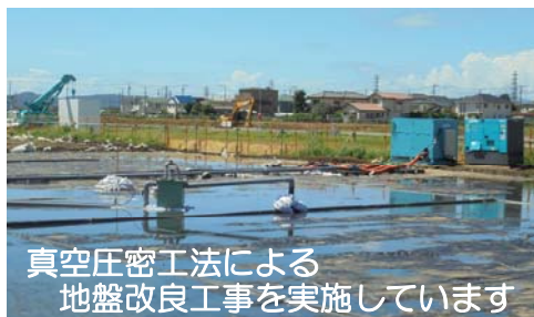
真空圧密工法による地盤改良工事を実施しています