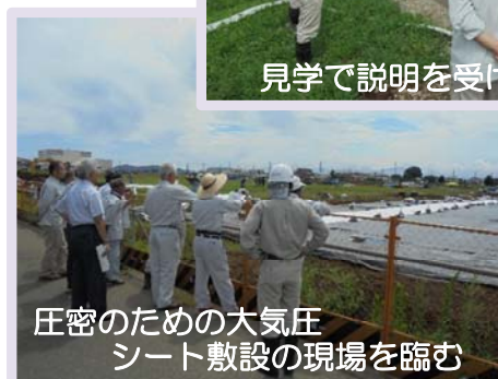
圧密のための大気圧シート敷設の現場を臨む