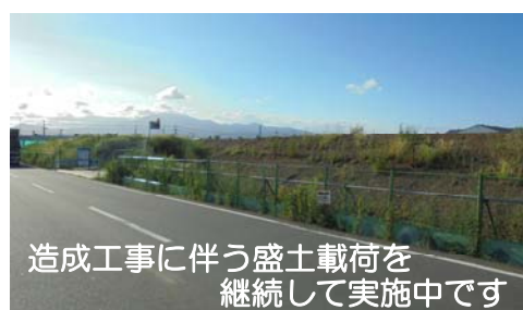
造成工事に伴う盛土載荷を継続して実施中です