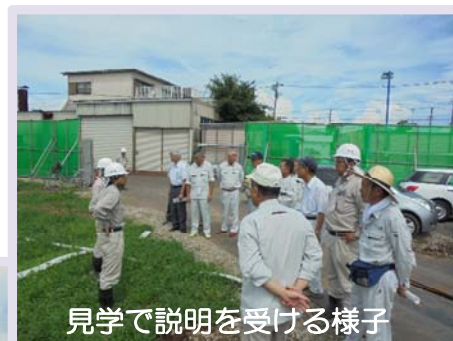
見学で説明を受ける様子

平成28年8月3日（水）に、施工業者である鹿島建設(株)の案内による現場視察が行われました。理事長をはじめとする組合役員らの他、事務局員も含め約15名が参加いたしました。炎天下の中、説明担当者・参加者ともに、工事の進捗や工法について熱心な質疑のやり取りを行いました。これ以降も、最前線である現場への理解・関心を深めつつ、工事の円滑な進行に努めます。