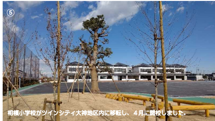
⑤ 相模小学校がツインシティ大神地区内に移転し、4月に開校しました。