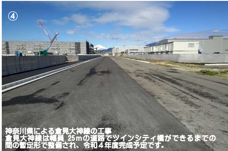
④ 神奈川県による倉見大神線の工事 倉見大神線は幅員25mの道路でツインシティ橋ができるまでの間の暫定形で整備され、令和4年度完成予定です。