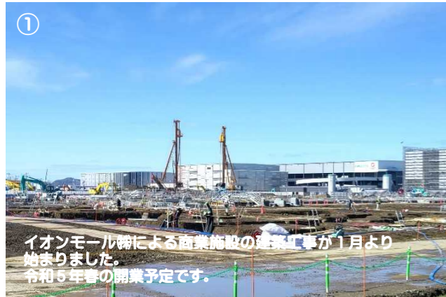
① イオンモール株による商業施設の建築工事が1月より始まりました。令和5年春の開業予定です。

令和4年4月現在の地区の状況を写真でご紹介します。 令和4年度では、ツインシティ大神線に接続する幹線道路が完成予定です。