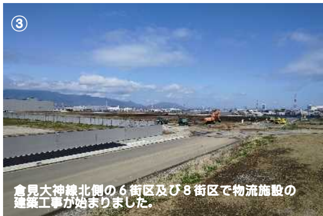
③ 倉見大神線北側の6街区及び8街区で物流施設の建築工事が始まりました。