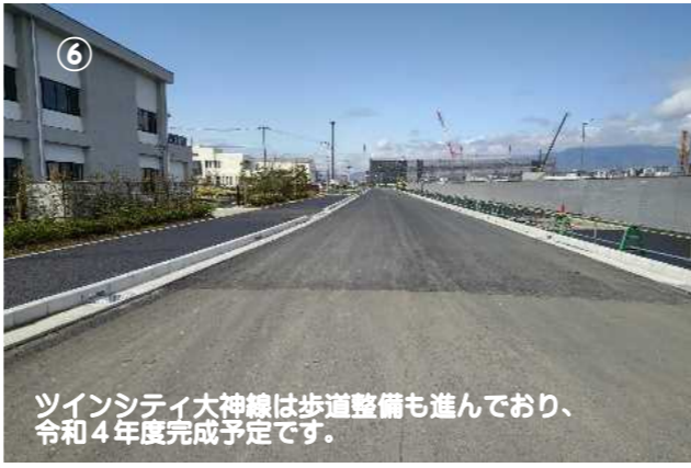
⑥ ツインシティ大神線は歩道整備も進んでおり、令和4年度完成予定です。