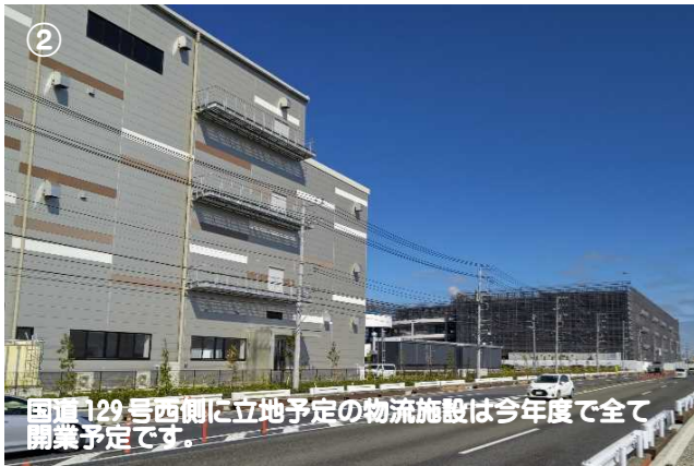
② 国道129号西側に立地予定の物流施設は今年度で全て開業予定です。