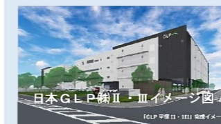
日本GLP(株)II・IIIイメージ図 GLP(株)II・IIIイメージ図