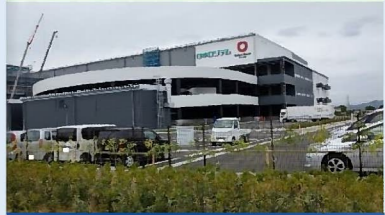
大和ハウス工業(No2) 令和3年3月竣工