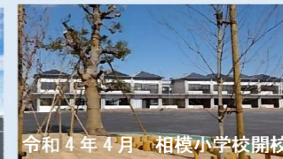
令和4年4月 相模小学校開校