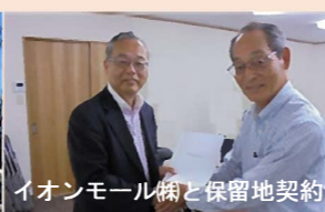
イオンモール(株)と保留地契約