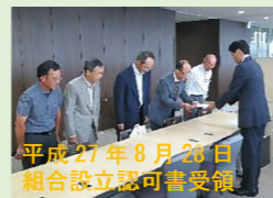
平成27年8月20日 組合設立認可書受領