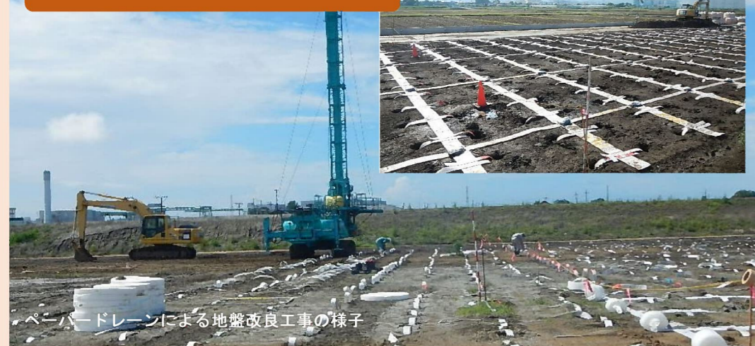
ペーパードレンによる地盤改良工事の様子