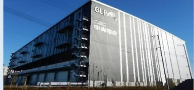
日本GLP(株) 令和3年12月43街区開業