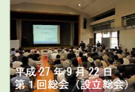
平成27年9月22日 第1回総会(設立総会)