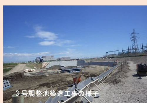
3号調整池築造工事の様子