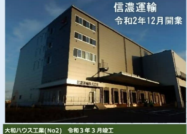
信濃運輸 令和2年12月開業