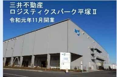
三井不動産 ロジスティクスパーク平塚II 令和元年11月開業