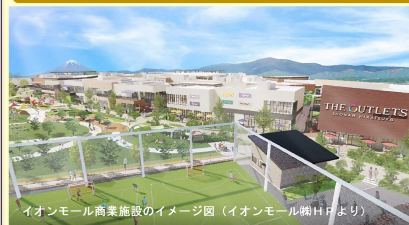
イオンモール商業施設のイメージ図