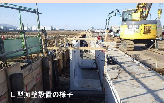
L型擁壁設置の様子