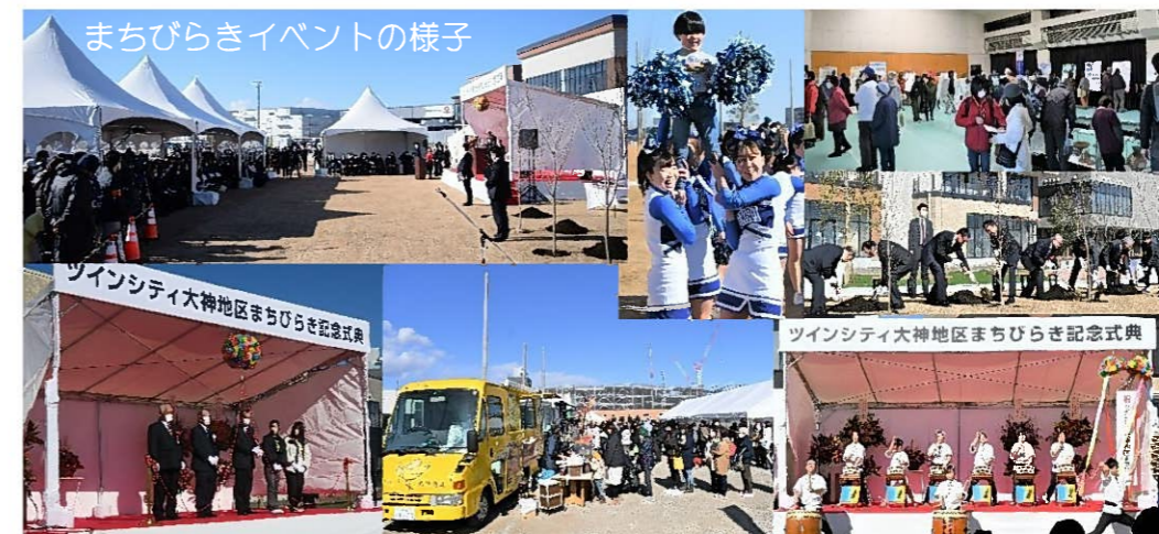
まちびらきイベントの様子

今後は1日も早くこの事業を完了できるよう組合役員一同一層気を引き締めて取り組みますので、皆様のご理解ご協力をいただきますようよろしくお願いいたします。