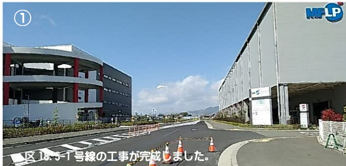
① 区18-5-1号線の工事が完了しました。

令和5年4月現在の地区の状況を写真でご紹介します。 地区内幹線道路の工事が終わり、令和5年度では残りの街路築造工事や公園工事に着手予定です。