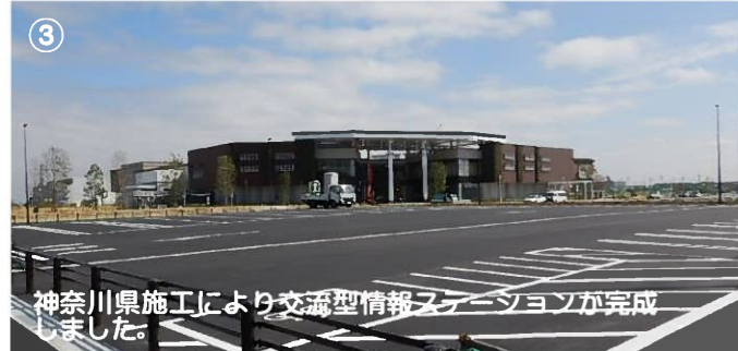
③ 神奈川県施工により交流型情報マージョンが完成しました。