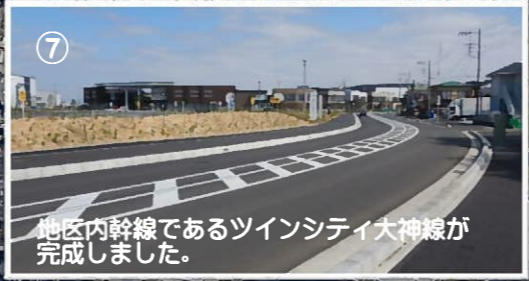
⑦ 地区内幹線であるツインシティ大神線が完成しました。