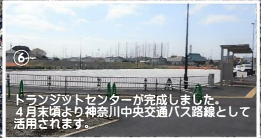
⑥ トランジットセンターが完成しました。4月末頃より神奈川中央交通バス路線として活用されます。