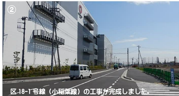
② 区18-1号線(小稲葉線)の工事が完了しました。