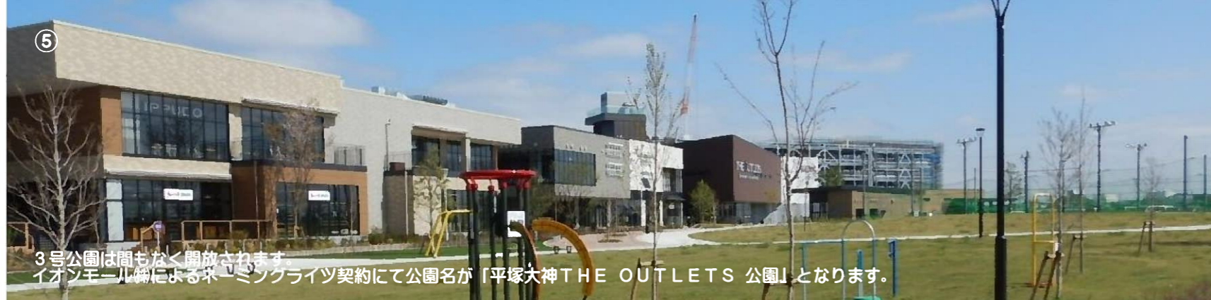
⑤ 3号公園は間もなく開放されます。イオンモール様によるネーミングライツ契約にて公園名が「平塚大神 THE OUTLETS 公園」となります。