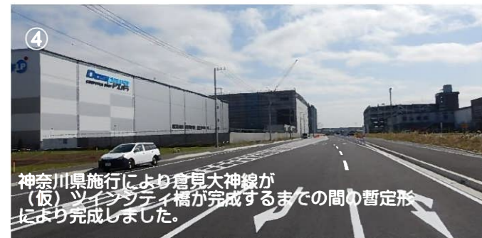
④ 神奈川県施工により倉見大神線が(仮)ツインシティ橋が完成するまでの間の暫定形にまで完了しました。