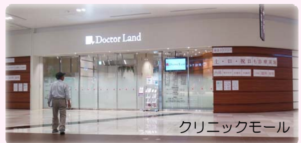
クリニックモール

大神地区でのイオンモールに対しても先進的な省エネ関連の取り組みと共に、 田村堀を活かしたせせらぎの創出、富士山への眺望 などの 地域特性に配慮した環境共生の取り組み 等によって「 “人”と“緑”と“未来”をつなぐ おおかみの杜 」の実現を目指すという、熱意のこもったご説明がありました。