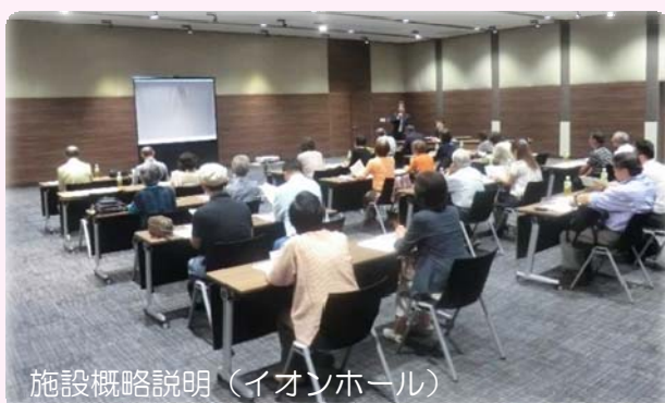
施設概略説明（イオンホール）

参加者の皆様には先進的なイオンモールの取り組みを実際に見学されて、大変満足していただきました。また、見学後の感想として、大神地区にも医療施設（クリニックモール）や緑化等の環境共生への取り組みを望む声を多くいただきました。