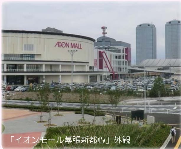
「イオンモール幕張新都心」外観

平成26年6月10日（火）に、21名の参加により「イオンモール幕張新都心」へ、環境共生、エコエネルギーの活用、周辺との調和等に対する取り組みなどを実際に体感するため、施設見学ツアーを実施いたしました。